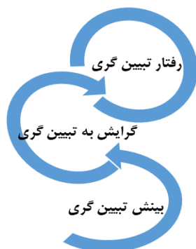
شکل ۱. ارتباط بین بینش و گرایش و رفتار در تبیین‌گری

بنابراین در الگوی تربیتی مورد نظر این پژوهش که قرار است به بروز رفتار تبیین‌گری در افراد بینجامد، بایستی به پرورش بینش تبیین‌گری در فرد پرداخته شود. از همین رو در ادامه به بایسته‌های لازم برای پرورش بینش تبیین‌گری از منظر نهج البلاغه پرداخته می‌شود: