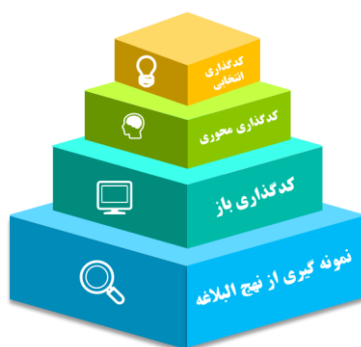
شکل ۲. مراحل گذار از نظریه رهبری آموزشی در نهج البلاغه

جامعه مورد مطالعه در این پژوهش کتاب نهج البلاغه است که با حساسیت نظری و استفاده از نمونه گیری نظری به روش کتابخانه‌ای تا رسیدن به اشباع نظری تعداد ۳۰۰ مورد پژوهش از نهج البلاغه به عنوان نمونه برای تحلیل انتخاب شد، این مجموع سند شامل ۱۲۴ خطبه، ۴۶ نامه و ۲۰۰ حکمت که حاوی مضمون رهبری آموزشی هستند و با استفاده از نرم افزار MAXQDA2022 در سه مرحله گذار از بازار، محوری، انتخابی) برای پاسخگویی به سؤالات این پژوهش در راستای هدایت به سمت مؤلفه و تئوری رهبری آموزشی در نهج البلاغه مورد تحلیل و بررسی قرار گرفتند.