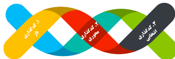
Figure 1. Chain communication, 3 stages of open, axial and selective coding

The design of the current research is descriptive with a qualitative nature using the grounded theory method to reach the theory and conceptual model of educational leadership in Nahjul Balagha.