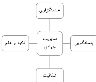
شکل ۱: مؤلفه‌های مدیریت جهادی (محمدزاده، ۱۳۹۳: ۲۱)

همچنین خاشعی (۱۳۹۵)، در مقاله‌ای با عنوان «کاوشی در مؤلفه‌های مدیریت جهادی با الهام از فرهنگ جهادی انقلاب اسلامی»، با استفاده از روش مطالعه موردی به دنبال استخراج مدل مدیریت جهادی از تجربیات موفق انقلاب اسلامی است که تمامی عرصه‌های اقتصادی، فرهنگی و علمی، سیاسی و نظامی را شامل می‌شود. گرچه پژوهش وی مشخصاً به بحث فرهنگ جهادی می‌پردازد اما این مقاله با استفاده از شواهد عینی چند واقعه مدیریتی در انقلاب اسلامی به دنبال استخراج مؤلفه‌های مدیریت جهادی است که این مؤلفه‌ها می‌تواند در جهاد علمی پیش روی کشور نیز قابل سیاست‌گذاری و اجرا باشد (خاشعی، ۱۳۹۳: ۱۳۱ و ۱۶).