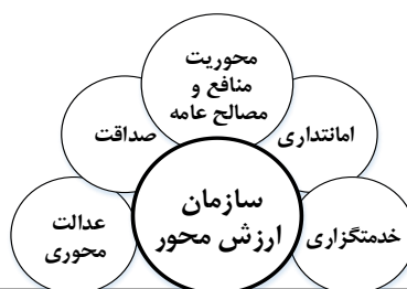
شکل ۱: الگوی ارزش‌های اسلامی از دیدگاه قرآن و نهج‌البلاغه در تحقیق حاضر

شکل (۱)، مؤلفه‌های یک سازمان ارزشی را براساس آرمان‌های اسلامی برای غلبه بر محیط پرآشوب بیرونی و دستیابی به جو مطلوب درونی در پنج شاخصه شامل امانت‌داری، خدمت‌گزاری، عدالت‌محوری، صداقت و محوریت منافع و مصالح عامه نشان می‌دهد.