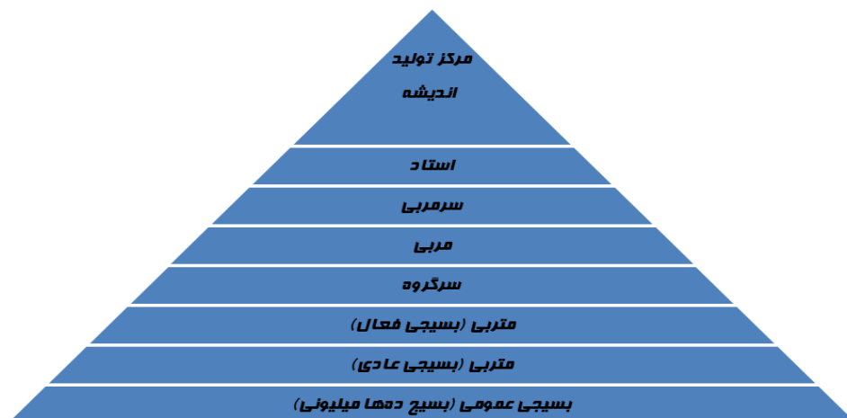
شکل ۱: ارکان طرح صالحین بسیج