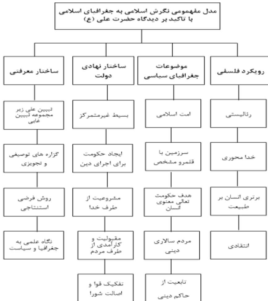
نمودار ۲: مدل مفهومی نگرش اسلام به جغرافیای سیاسی با تأکید بر دیدگاه امام علی (ع)