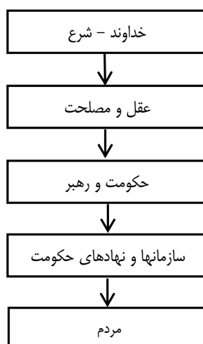
نمودار ۱: مدل و ساختار نظام سیاسی - اداری حکومت از دیدگاه امام علی (ع)

مرکزی که نقش کانون سیاسی را دارد، در امور سیاسی و قانون گذاری مستقل عمل می کند ولی در امور اداری و خدماتی وظایف و اختیاراتی را به واحدهای محلی تفویض می کند. سپس سازوکارهای نظارتی خاصی را با توجه به اصل مسؤولیت خواهی، برای کنترل عملکرد مسئولان و کارگزاران حکومتی اعمال می کند. همچنین در این مدل حکومتی، برای تحقق مشارکت جویی و جلوگیری از استبداد حاکمان، به اصول شورا و تفکیک قوا اصالت داده شده است (آثسی، ۱۳۹۲: ۷۷).